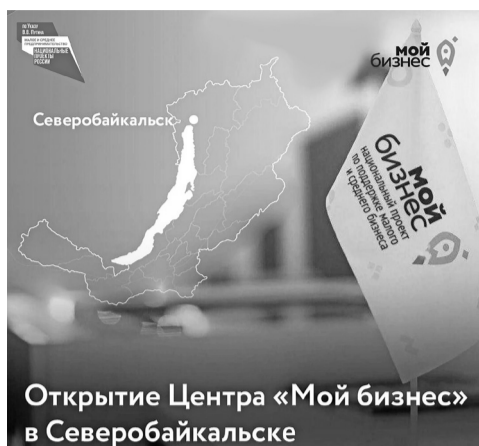
Открытие Центра «Мой бизнес» в Северобайкальске

В центре «Мой бизнес» предприниматели могут получить все виды консультаций: получить услугу по регистрации нового бизнеса или по обслуживанию уже готового можно по принципу «одного окна»; оформить ИП, провести аудит компании, узнать о мерах господдержки и как ими воспользоваться, получить услуги маркетинга и продвижения на рынке и т.д. Например, в Центрах «Мой бизнес» можно открыть свой бизнес в формате «одного окна», проконсультироваться по кредитованию, налогообложению, бухгалтерии, пройти обучение по предпринимательству. Все консультационные услуги бесплатные. Предприниматели Северобайкальска и Северо-Байкальского района, интересующихся быстрой и адресной государственной поддержкой, ждут по адресу: